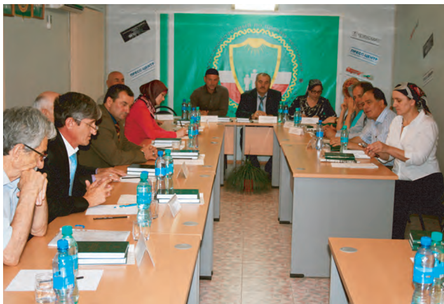
Презентация книги Н.С. Нухажиева «Не имею права молчать»