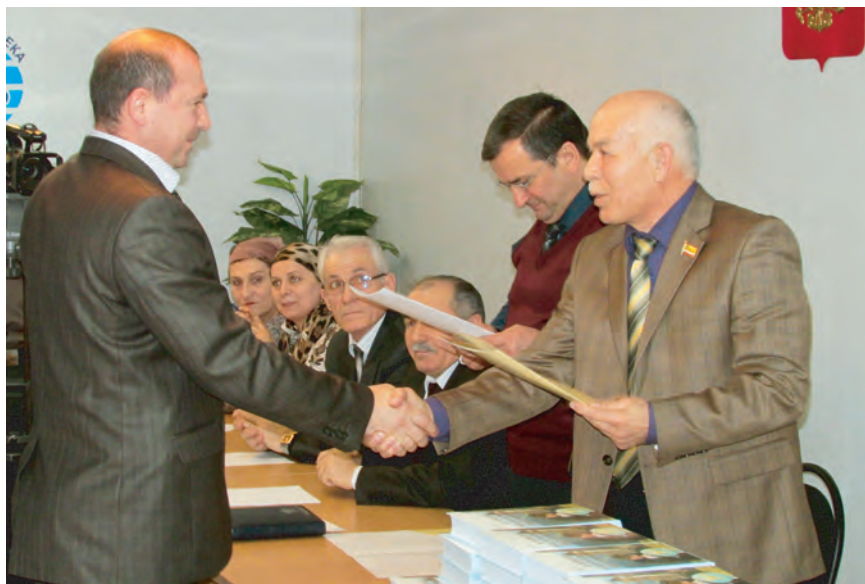
Руководитель аппарата Уполномоченного по правам человека в Чеченской Республике вручает почетные грамоты педагогам республики