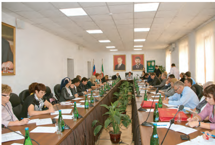
Общероссийская конференция «Крепкая семья – основа России». Сентябрь 2013 г., г. Грозный