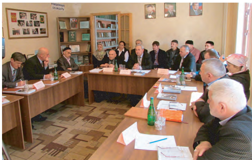
Круглый стол, посвященный 10-летию со дня референдума по принятию Конституции Чеченской Республики, проходит в сельской библиотеке с. Гордали-Юрт