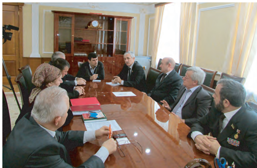
Уполномоченный и сотрудники его аппарата на встрече в Верховном суде Чеченской Республики