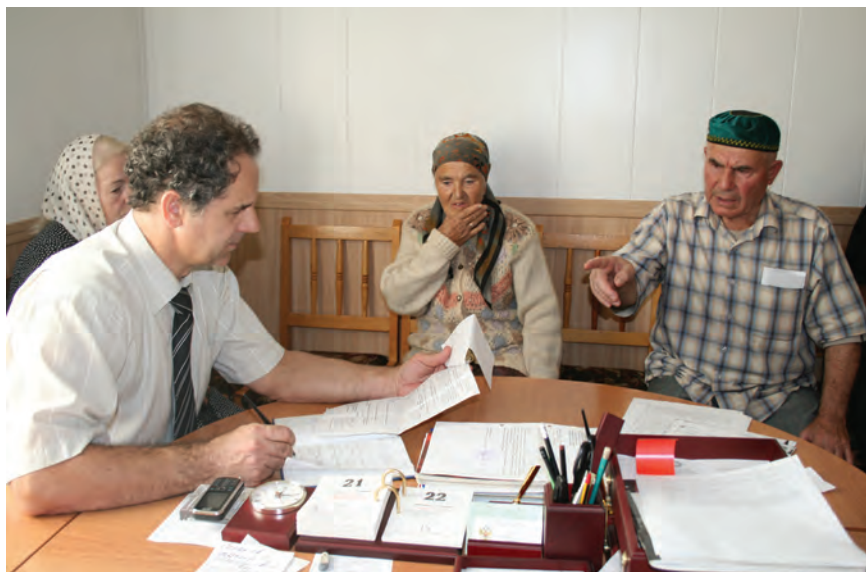
Прием граждан в региональном представительстве Уполномоченного ведег Лема Цахигов