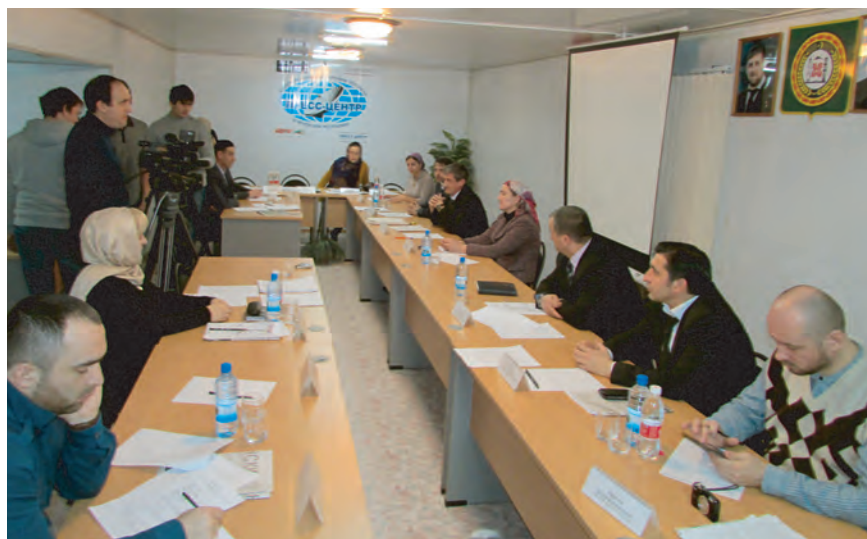
В офисе Уполномоченного проходит круглый стол, посвященный становлению гражданского общества в Чеченской Республике