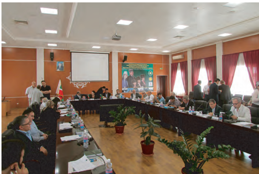
Пятый кавказский форум правозащитников – организован при поддержке Уполномоченного по правам человека в Чеченской Республике