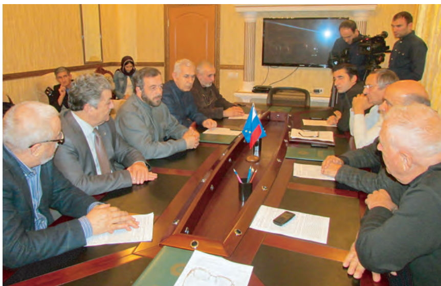
Круглый стол, посвященный теме дискриминации по национальному и конфессиональному признакам