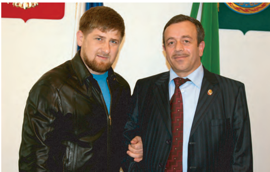
Глава Чеченской Республики Р.А. Кадыров и Уполномоченный по правам человека в Чеченской Республике Н.С. Нухажиев. Фото на память после рабочей встречи