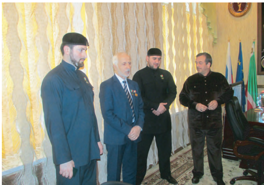
Фото на память после вручения наград