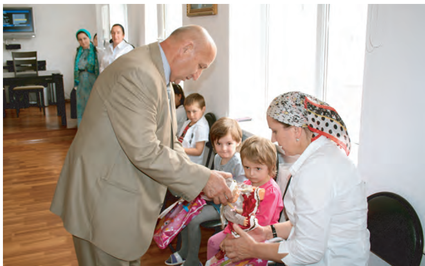
Благотворительная акция в Шатойском реабилитационном центре