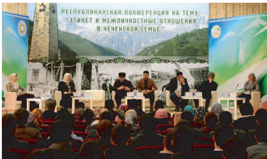
Республиканская конференция «Этикет и межличностные отношения в чеченской семье». Октябрь 2013 г., г. Грозный