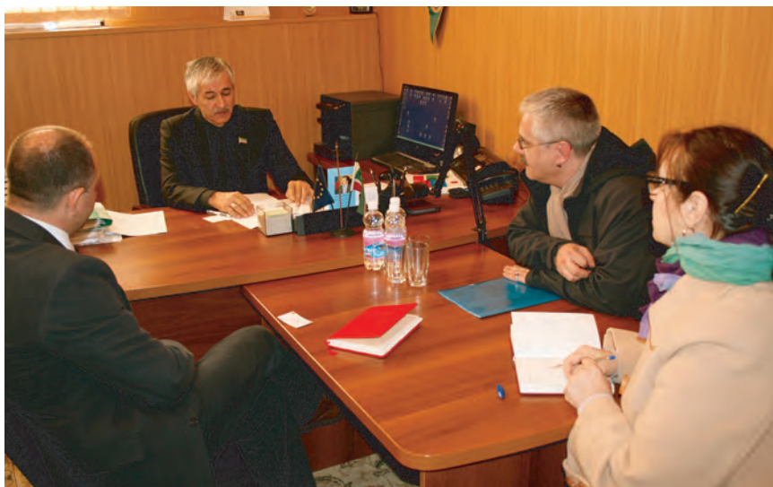
Начальник управления по приему и консультации граждан в офисе Уполномоченного принимает представителей Международного Комитета Красного Креста