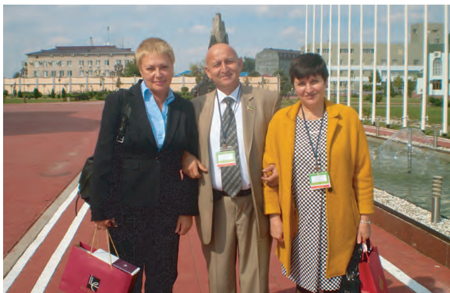
Коллеги из регионов. Фото на память