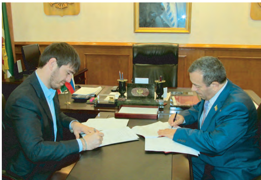
Мэр г. Грозного Ислам Кадыров и Уполномоченный по правам человека в ЧР Н.С. Нухажиев подписывают соглашение о взаимодействии