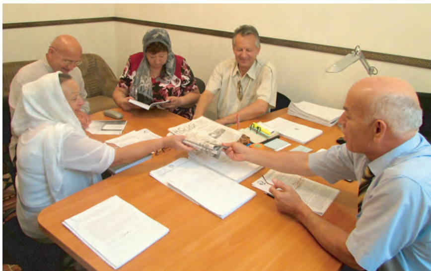
Делегация комитета солдатских матерей из города Астрахань посетила офис Уполномоченного по правам человека в ЧР