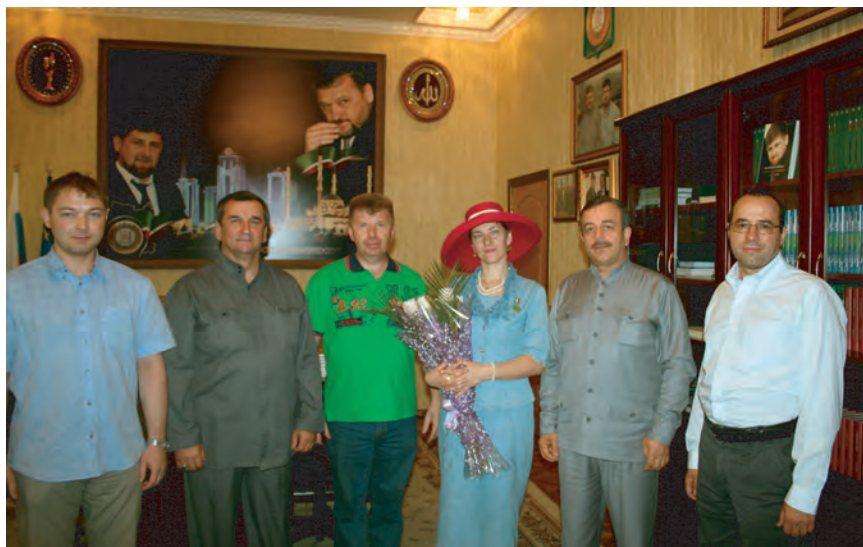
За заслуги в защите права граждан на охрану здоровья врачи ФЦССУ города Астрахань отмечены наградами Уполномоченного