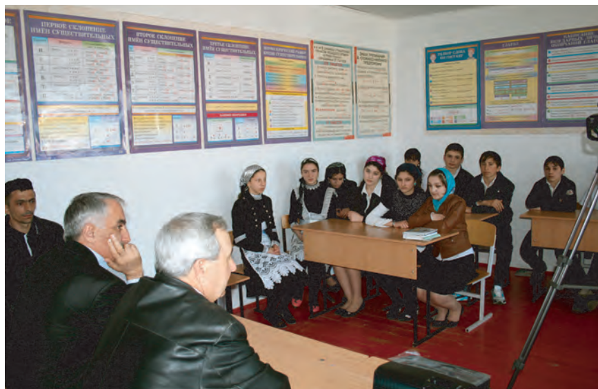
Очередное занятие в школе по программе правового просвещения проводят сотрудники аппарата УПЧ в ЧР