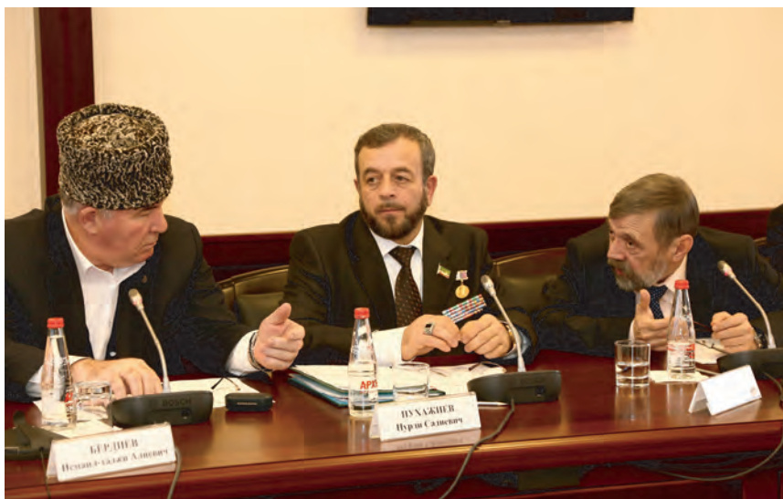
Уполномоченный по правам человека, председатель комиссии по правам человека Общественного совета СКФО на VI заключительной конференции ОС СКФО