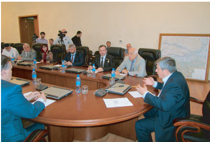
Встреча в Парламенте Чеченской Республики с представителями СМИ