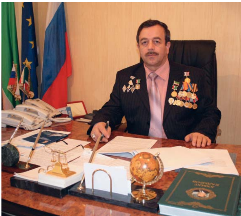
Уполномоченный по правам человека в Чеченской Республике Нурди Садиевич Нухажиев