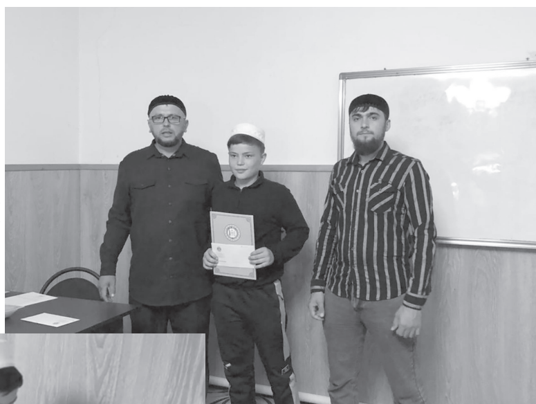
Уполномоченный по правам человека в Чеченской Республике Нурди Нухажиев.

Отрадно, что получить начальное исламское образование в нашей республике можно сегодня и в отдаленных населенных пунктах. Это возможность есть и в моем род-