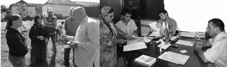
Будни аппарата Уполномоченного по правам человека в ЧР

моченного по правам человека в ЧР защищать права человека? Во многих случаях - да. Получается тогда, когда сам человек го-