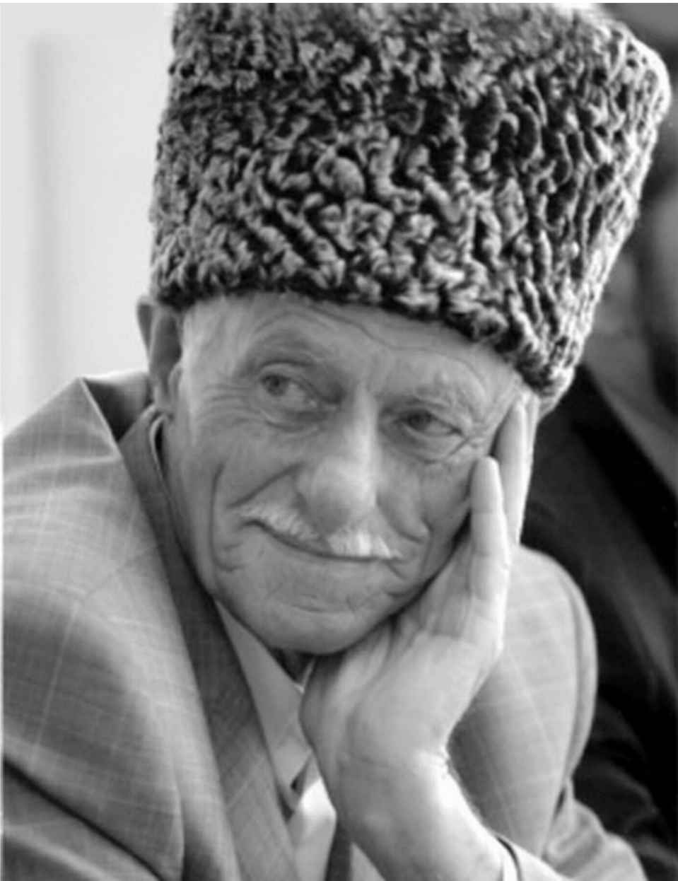
АЙДАМИРОВ АБУЗАР АБДУЛХАКИМОВИЧ (1929 (1933) - 2005 гг.)

стихотворений, на слова некоторых из них позднее были созданы песни («Тебе», «Говорил, быть желая с тобою счастливым» и другие).