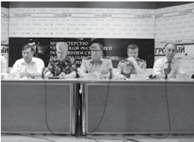
В СТУДИИ ИНФОРМАЦИОННОГО АГЕНТСТВА «ГРОЗНЫЙ - ИНФОРМ» 26 ИЮНЯ ПРОШЛА ПРЕСС- КОНФЕРЕНЦИЯ, ПРИУРОЧЕННАЯ К МЕЖДУНАРОДНОМУ ДНЮ В ПОДДЕРЖКУ ЖЕРТВ ПЫТОК.